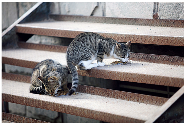
2026年2月15日，上海，嘉定区小区内的流浪猫。近年上海小区内的流浪猫数量众多，且繁殖速度极快。目前上海各区的社区正在探索科学治理的模式，设立固定投喂点和智能猫屋等。

如果民间照料者容易成为被找到、被投诉和被处罚的人，城市流浪动物治理真正缺失的是什么？