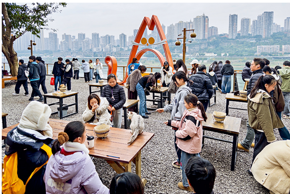
2026年2月3日，重庆南岸，萤火虫港湾猫猫主题乐园一角，民众与猫咪互动。